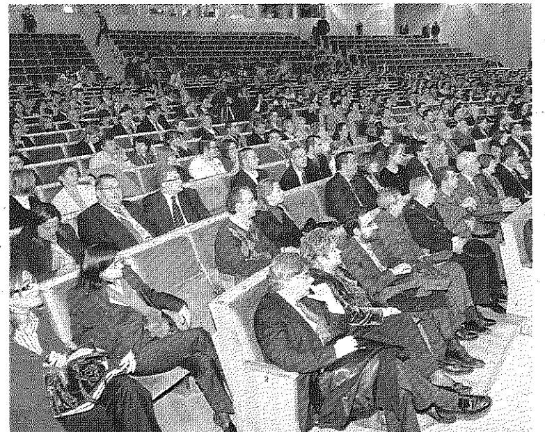
Asistentes al acto de apertura en el Palacio de Congresos.