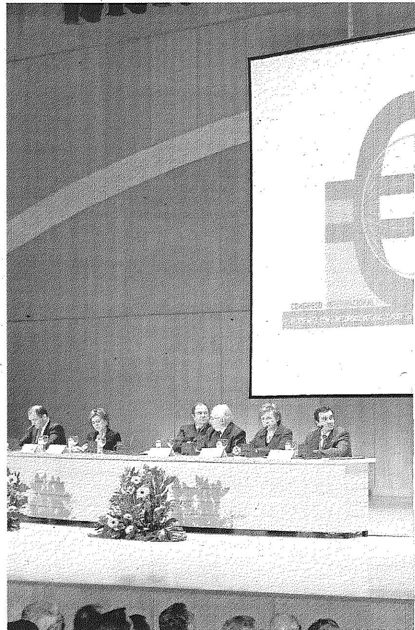
Las autoridades en la inauguración del congreso.

Tras repasar la historia del español y su estrecho vínculo con Salamanca, Lanzarote aseguró que "hay que involucrar a toda la ciudadanía y convertir el español en el valor añadido" para los turistas que visitan la provincia.