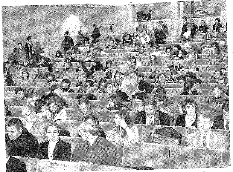
El público en la sala menor donde se presentó el informe de Turespaña.

En cuanto a la demanda potencial, hay 7 millones en el continente americano, 3,5 millones en Europa y 172.236 en Asia, cifras que ponen de manifiesto el gran mercado del turismo idiomático, ya que en el año 2007 el número de alumnos de castellano en España era de 237.600, siendo el 73% europeos, y un 21,8% americanos. En este sentido hay que destacar el incremento en 100.000 personas que se ha producido en los últimos seis años y del que se ha beneficiado Castilla y León, que acapara el