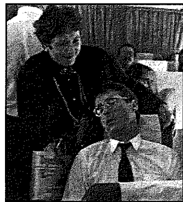
Gunhild Øyangen og Jan Henry T. Olsen på vei hjem, etter harde forhandlinger i Brussel.

Ifølge Landbruksdepartementet vil det i disse områdene «være